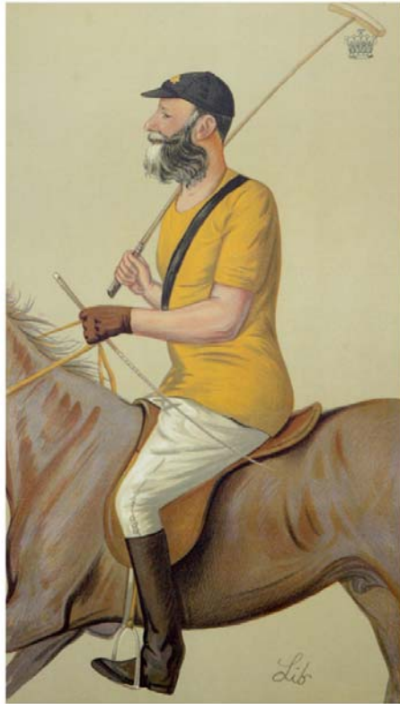
Stick e3 Ball Fotografie-Ausstellung